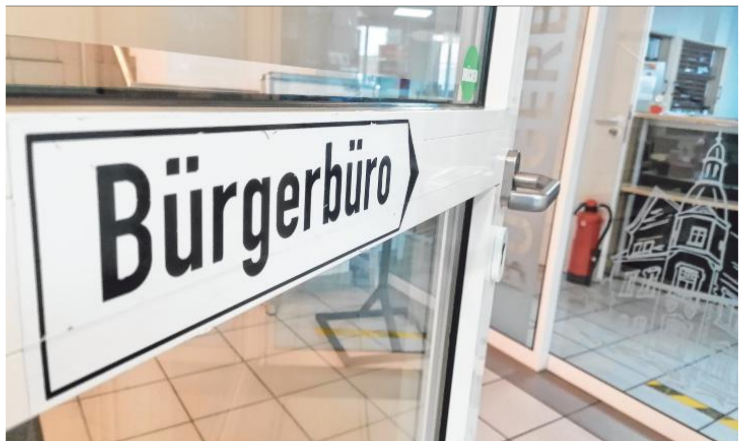
Ein Stück zurück zur Normalität: Bürgerbüro und Standesamt können wieder nahezu alle gewohnten Services anbieten. Ab sofort gelten auch wieder die üblichen Öffnungszeiten.