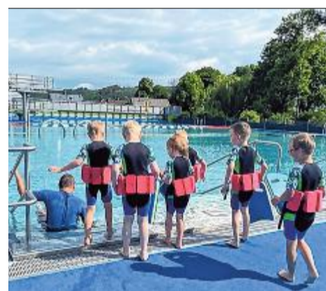
Ab ins Wasser: Auch 2024 werden wieder Schwimmkurse für Kinder angeboten.

Die Einsteigerkurse kosten 159 Euro pro Kind, der Festigungskurse 89 Euro. „Die Kurse sind in Planung. Freie Termine können interessierte Eltern telefonisch direkt bei uns im Schwimmbad unter Tel. 01 57 / 78 78 63 12 erfragen oder auf Informationen bei Facebook