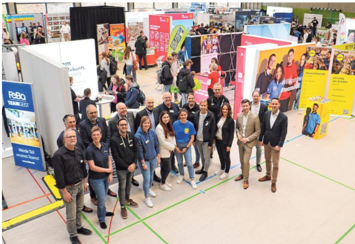
Die Vertreter der Rathäuser sowie die Repräsentanten des Gründerkreises der Ausbildungsmesse werten die 7. Auflage der Messe erneut als Erfolg.