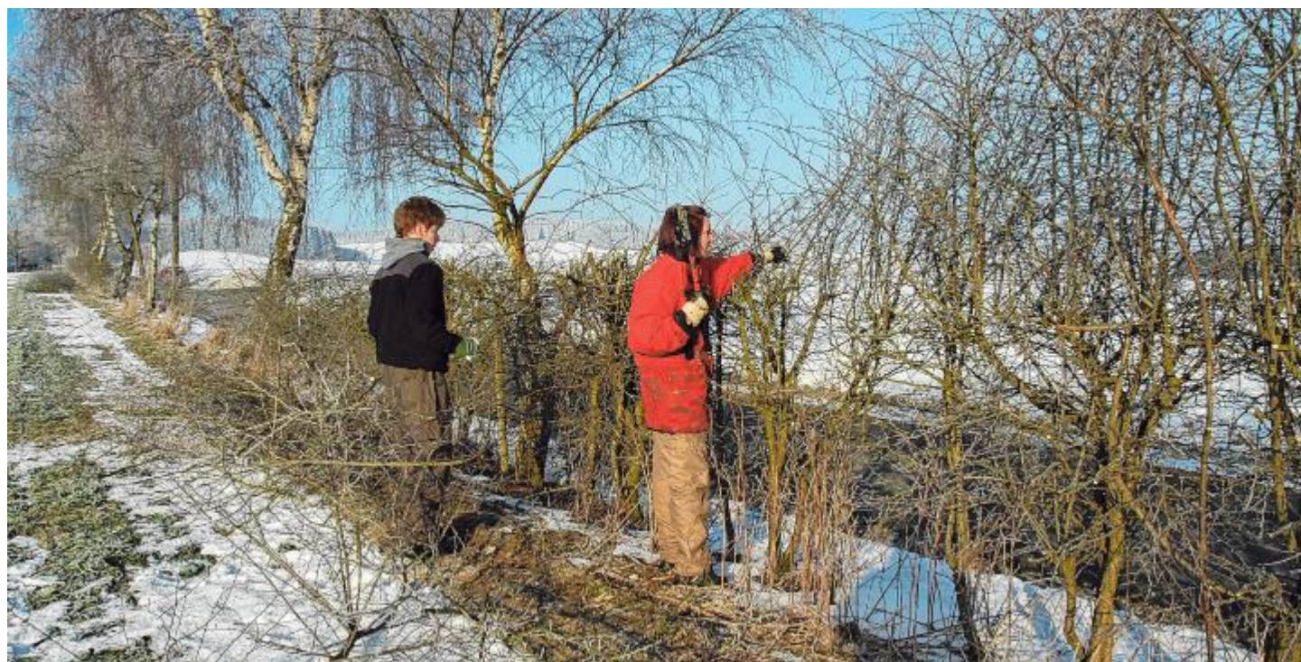
Alle Vögel sind bald da – Zum Brutvogelschutz dürfen Hecken ab dem 1. März als mögliche Brutstätten nicht mehr zurückgeschnitten werden.