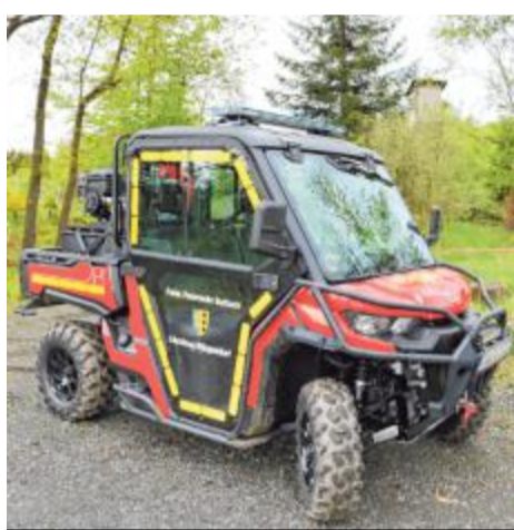
Das neue Spezialfahrzeug in seinem „natürlichen Lebensraum“. „Florian Burbach 9 Quad-01“ wird voraussichtlich häufiger im Wald zum Einsatz kommen.

Der Can-Am Traxter HD9 ist allradbetrieben und bietet einem Fahrer und zwei weiteren Personen Platz. Auf der Straße erreicht es eine Spitzengeschwindigkeit von gut 100 km/h. Es soll vor allem bei der Personensuche im Wald, bei der Wald- und Vegetationsbrandbekämpfung, bei der Personenrettung aus unwegsamem Gelände und für Erkundungsfahrten eingesetzt werden. Die individuelle Zusatzausstattung umfasst eine Seilwinde, LED-Zusatzstrahler, einen Blaulichtbalken mit Umfeldbeleuchtung und Heckwarnanlage, einen Unterbodenfahrerschutz, Stoßfänger rundum, eine Heizung, eine Anhängerkupplung und eine Befestigungsmöglichkeit für eine Schleifkorbtrage. Darüber hinaus wurde ein mobiles Löschmodul (Tank- und Saugbetrieb) installiert mit einem Tankinhalt von 320 Litern und einem maximalen Druck von 40 bar. Der Inhalt reicht für rund 10 Minuten Erstbrandbekämpfung. Dazu gibt es eine Fülleinrichtung für Löschrucksäcke. Zunächst ist eine Fahrleinweisung für einen kleineren Personenkreis vorgesehen. Das Fahrzeug kann über die Kreisleitstelle Siegen-Wittgenstein angefordert werden und wird durch die Feuerwehr Burbach, Einheit Würgendorf, besetzt.